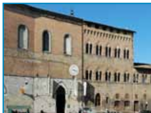
il nostro caro vecchio ospedale S. Maria della Scala

Nell'anno trascorso sono state organizzate numerose visite guidate ai monumenti della nostra città; tra queste ci piace ricordare: