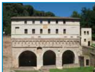
il museo dell'acqua con le fonti di Pescaia