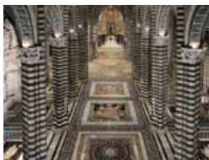
la porta del cielo e il pavimento del Duomo